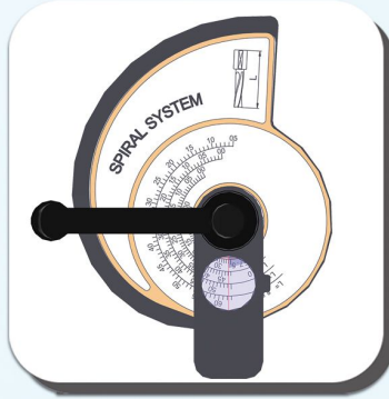
KOLAY DERİNLİK AYARI QUICK DEPTH SETUS