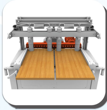
HIZLI YATAY DELME FAST HORIZONTAL DRILLING