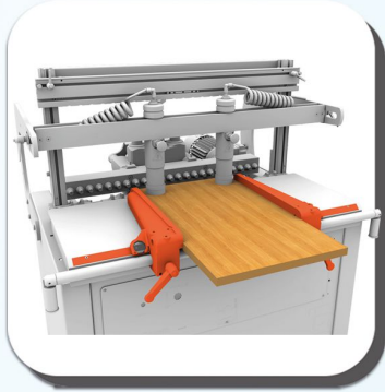
KUSURSUZ PANEL BİRLEŞİMLERİ PERFECT PANEL JOINTS