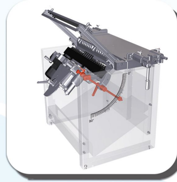
FARKLI AÇILARDA KULLANIM FLEXIBLE ANGLES